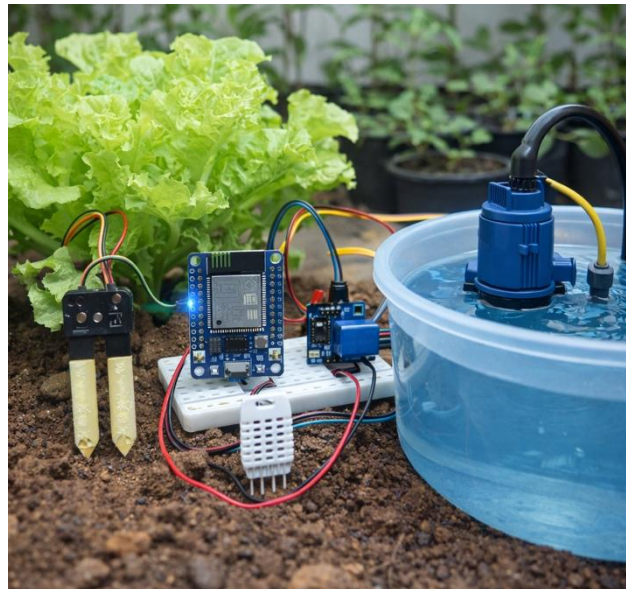
Gambar 3 Hasil Implementasi Sistem Smart Farming Selada Berbasis Io

Sensor soil moisture dipasang pada media tanam selada dan berfungsi untuk mengukur tingkat kelembaban tanah secara real-time. Sensor ini mengirimkan data kelembaban tanah ke mikrokontroler ESP32 untuk diproses. Selain itu, sensor DHT22 digunakan untuk mengukur suhu dan kelembaban udara di sekitar tanaman, sehingga kondisi lingkungan tanaman dapat dimonitor secara akurat. ESP32 berfungsi sebagai pusat pengendali sistem yang menerima data dari sensor, memproses data, dan mengirimkan data ke platform IoT melalui jaringan WiFi. Selain itu, ESP32 juga mengontrol modul relay yang berfungsi sebagai saklar elektronik untuk mengaktifkan atau menonaktifkan pompa air. Pompa air digunakan sebagai aktuator yang berfungsi untuk menyiram tanaman secara otomatis ketika kelembaban tanah berada di bawah nilai ambang batas yang telah ditentukan. Pompa air terhubung ke sumber air dan dikendalikan oleh relay yang dikontrol oleh ESP32.