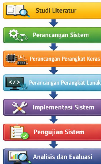
Gambar 1. Tahapan Penelitian

Tahapan penelitian yang dilakukan terdiri dari beberapa langkah sebagai berikut: